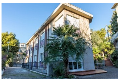
Résidence Cayol, Nice