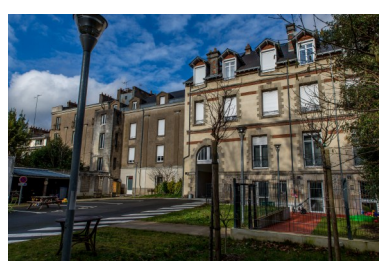
Maison Bastille, Nantes