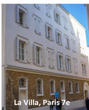
La Villa, Paris 7e