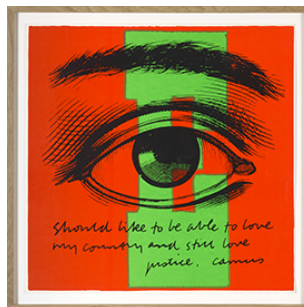
Corita Kent (Sister), Eye Love , 1968

Collection 49 Nord 6 Est - Frac Lorraine, Metz