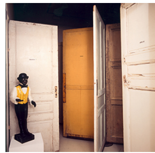
Willie Cole, The Elegba Principle , 1997

Collection 49 Nord 6 Est - Frac Lorraine, Metz